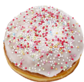
FÜR NUTELLA- LIEBHABER mit Nutellapudding