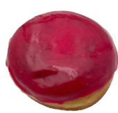
MIT KIRSCH mit einer fruchtig- süßen Kirschfüllung