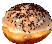
MIT EIERLIKÖR mit echtem Eierlikör- pudding (enthält Alkohol)