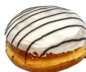
MIT VANILLE mit Vanillepudding