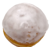
DER GLASIERTE mit Himbeere – Johannisbeere Konfitüre