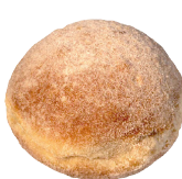
DER GEZUCKERTE mit Himbeere – Johannisbeere Konfitüre