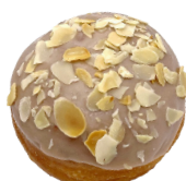
MIT BAILEYS mit leckerem Baileys- pudding (enthält Alkohol)